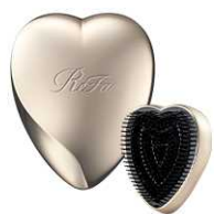
シャンパンゴールド